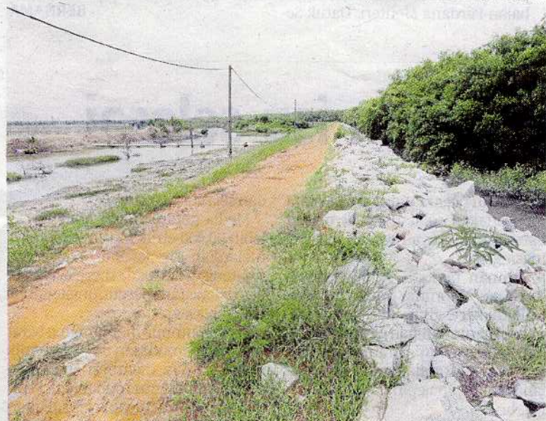
Jajaran ban batu dibina bagi mencegah hakisan di Pantai Sungai Belukang, Bagan Datuk.

Bagan Datuk: Jabatan Pengairan dan Saliran (JPS) Perak akan menebus guna semula sebahagian daripada tanah yang terhakis dan ditenggelami air laut akibat banjir besar sehingga mengakibatkan ban atau benteng pecah, di kawasan pantai Sungai Belukang di sini.