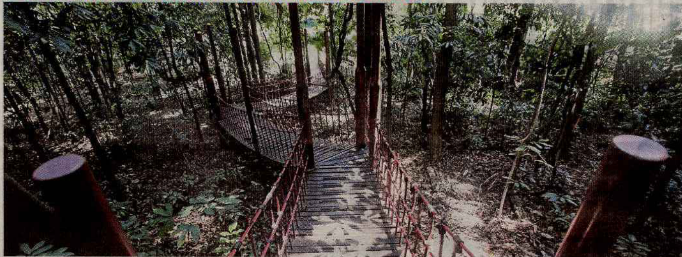
HSK perlu dipertahan demi kepentingan generasi masa hadapan.

SUSULAN BH BONGKAR ISU HUTAN SIMPAN KEKAL TERANCAM