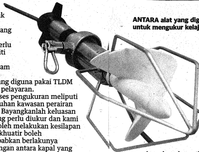
ANTARA alat yang digunakan oleh PHN untuk mengukur kelajuan ombak.

Menurut Zaa'im, penubuhan dan peranan PHN juga adalah selaras dengan dasar