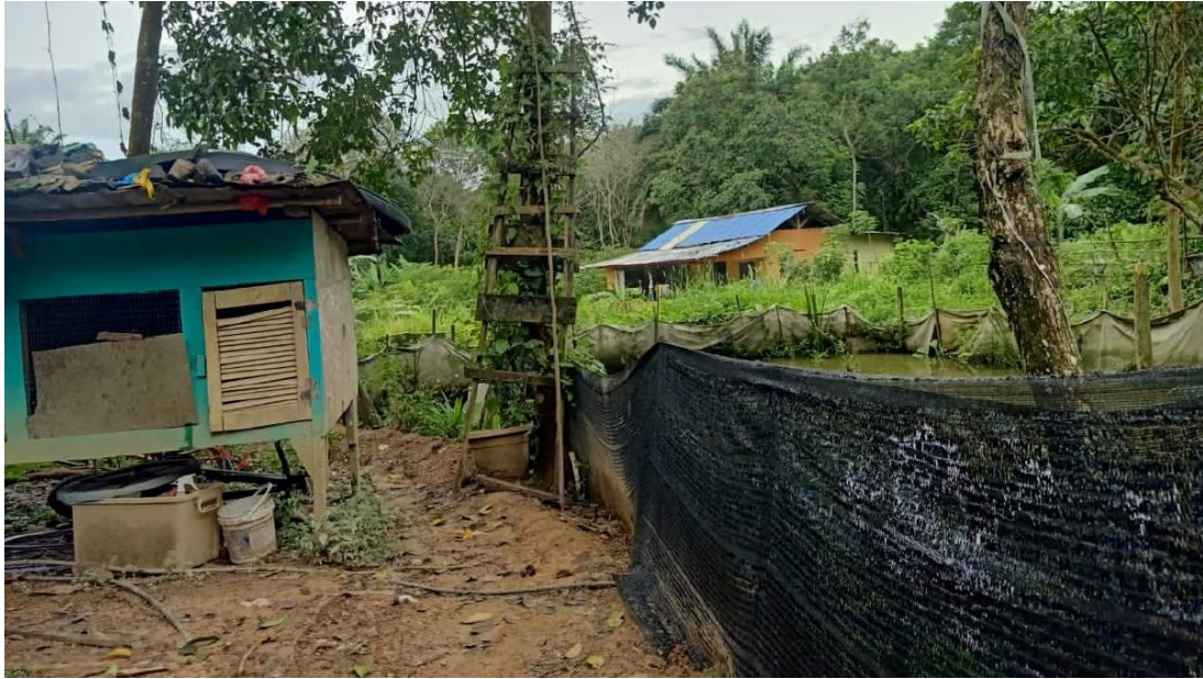
Kediaman di penempatan haram warga asing di Nilai selepas serbuan, 1 Februari lalu.

"Kami masih menjalankan siasatan dari semua aspek terhadap penempatan haram Pati itu berpandukan undang-undang sedia ada," katanya ketika dihubungi, hari ini.