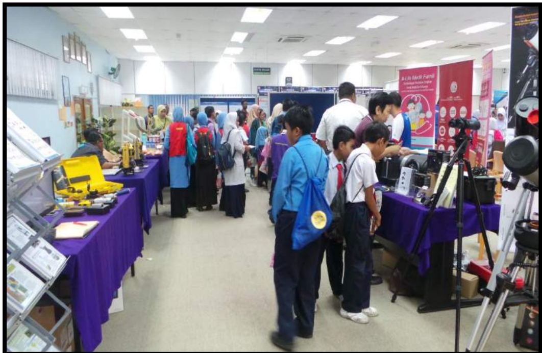
Aktiviti pameran falak / astronomi di perpustakaan INSTUN