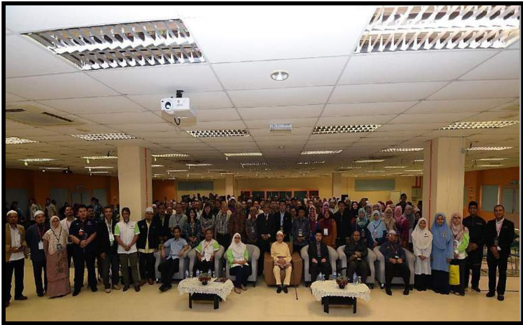
Gambar kenangan bersama tetamu-tetamu VIP, para peserta dan Jawatankuasa seminar Falak Nusantara