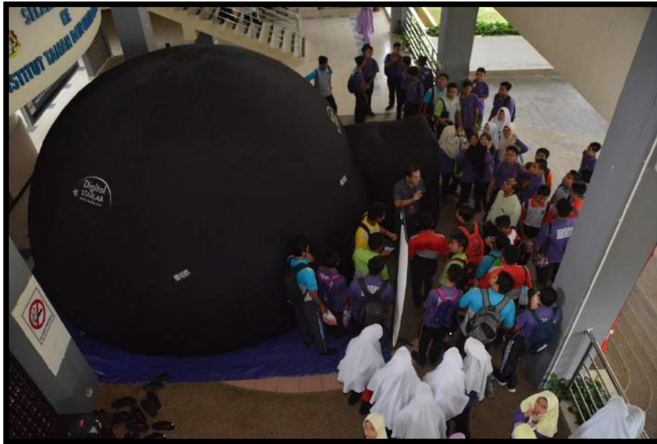
Aktiviti pertunjukan planetarium di lobi anjung INSTUN