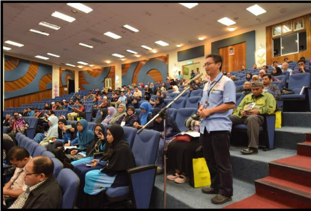
Sesi soal dan jawab daripada peserta seminar kepada pembentang