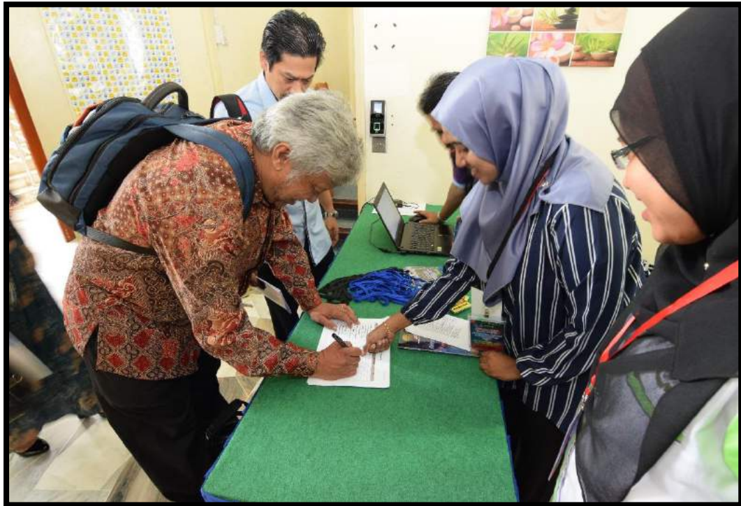
Proses urusan pendaftaran bagi moderator dan pembentang utama di pintu masuk auditorium