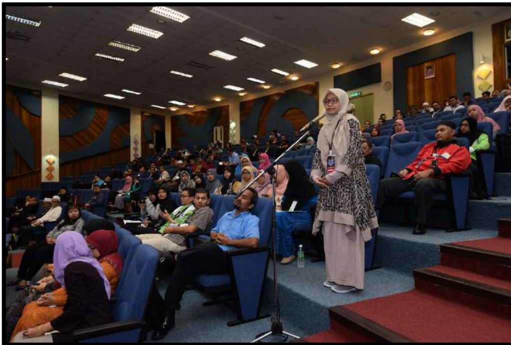
Sesi soal dan jawab daripada peserta seminar kepada pembentang