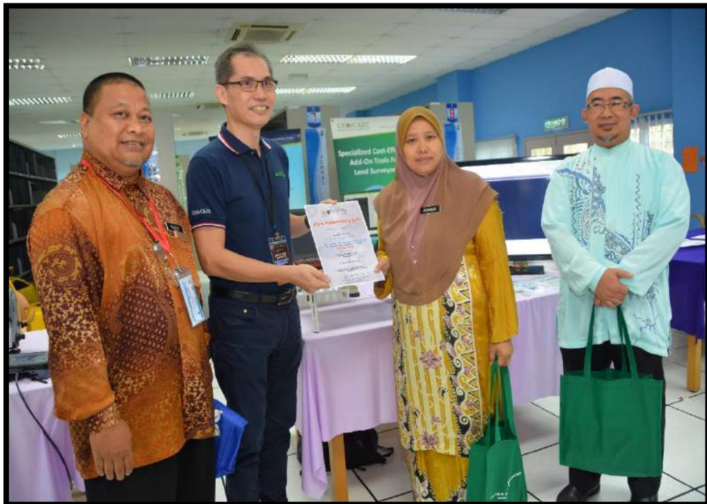
Penyampaian sijil penghargaan kepada syarikat luar yang menyertai seminar SARAS 2018