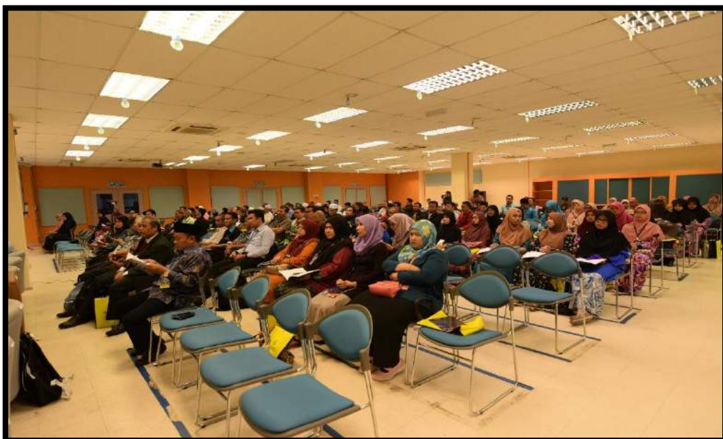
Para peserta seminar di majlis perasmian SARAS 2018