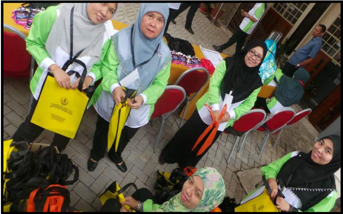
Urusetia INSTUN yang menguruskan proses pendaftaran pelajar