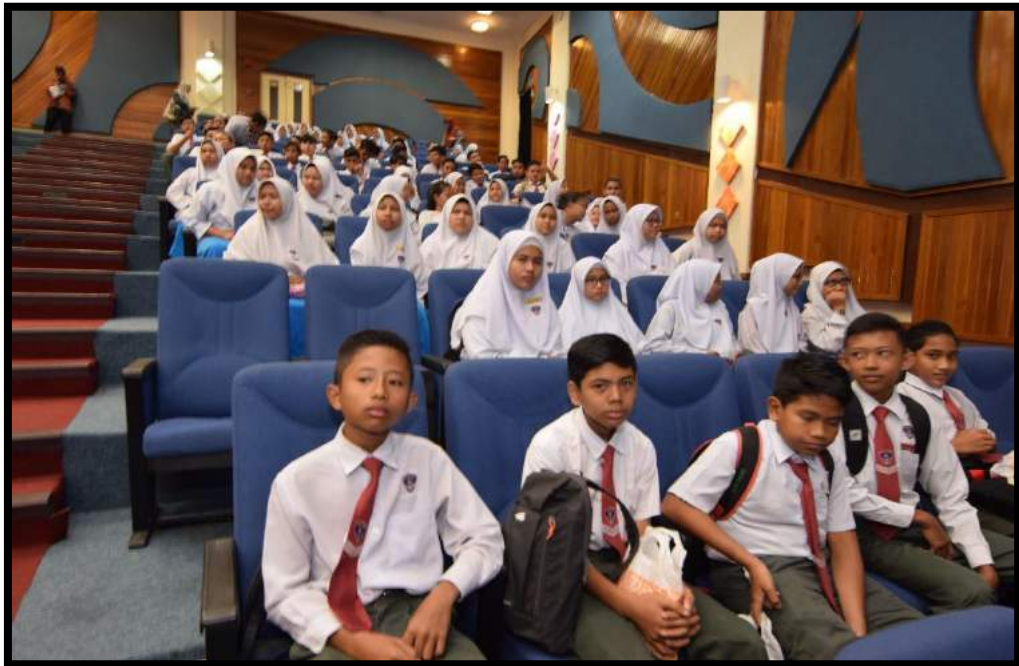
Kehadiran pelajar-pelajar sekolah