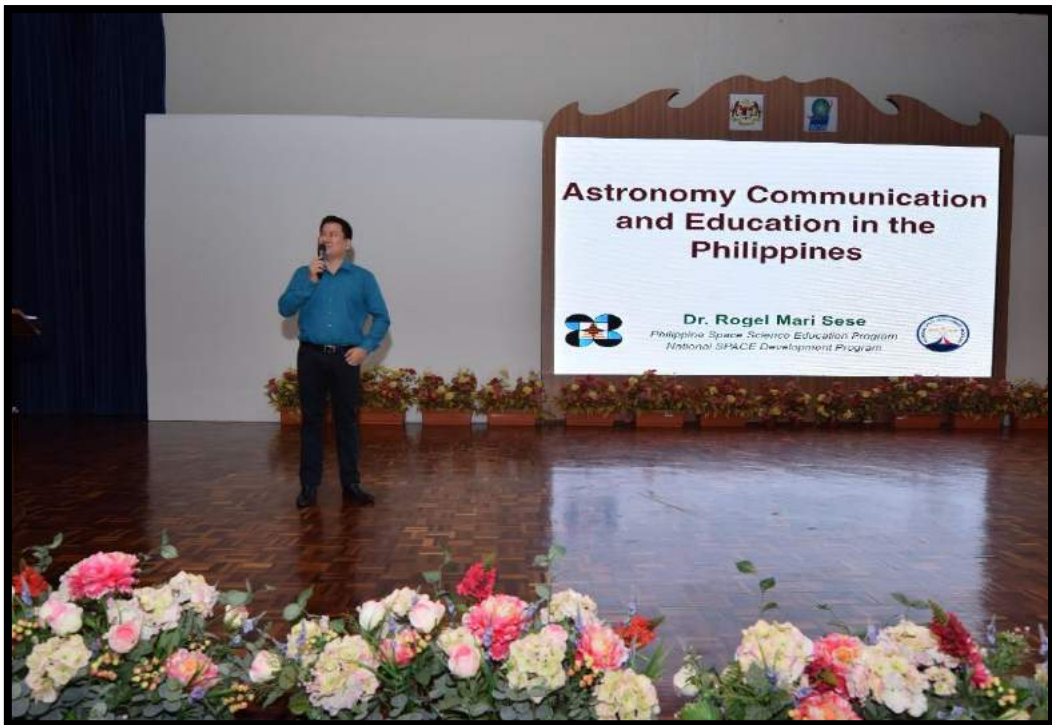
Pembentangan kertas kajian pada hari kedua dari pembentang negara Filipina