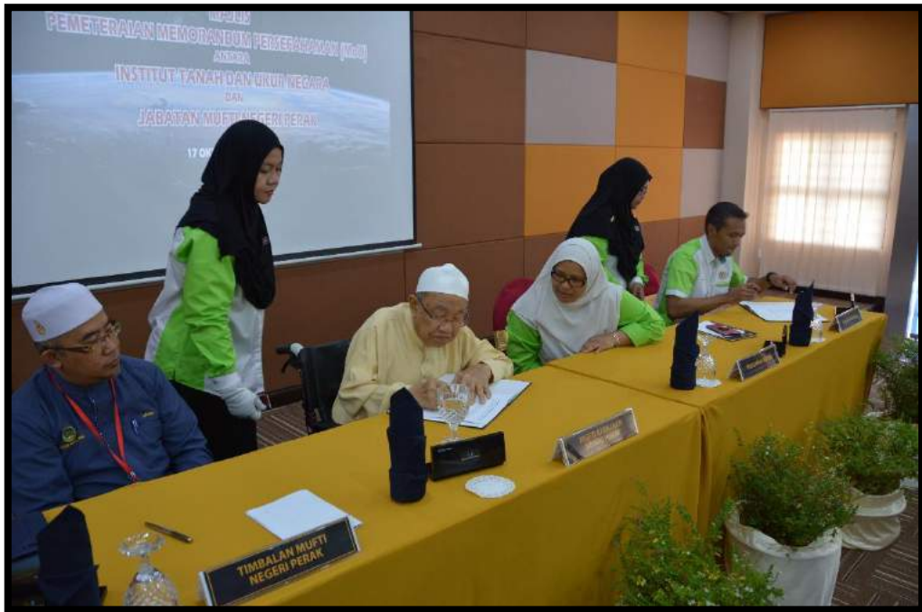
Majlis meterai MoU persefahaman diantara JMNPk dan INSTUN