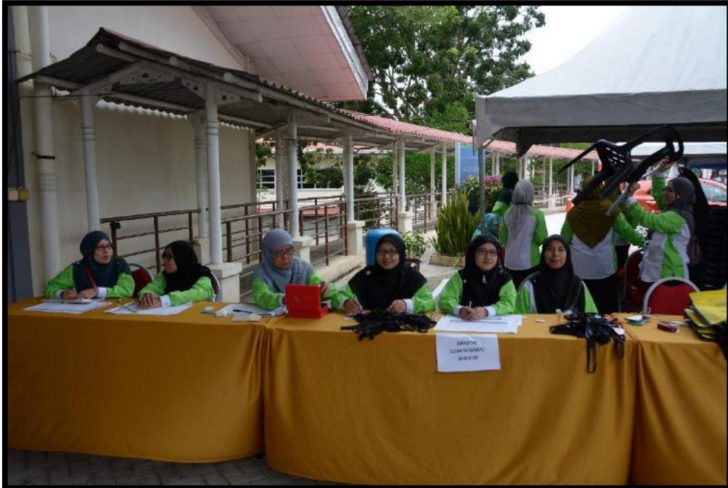
Kaunter pendaftaran yang terletak di anjung auditorium bagi tujuan pendaftaran peserta