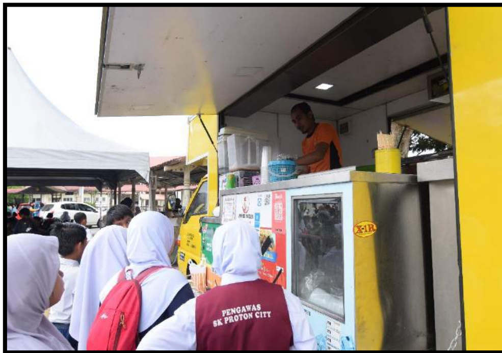
Penjualan makanan dan minuman di dalam "food truck" di tapak jualan di perkarangan auditorium INSTUN