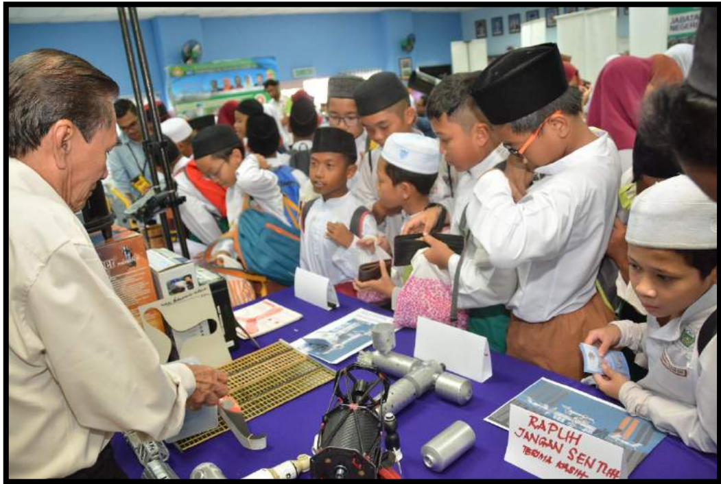
Aktiviti pameran falak / astronomi di perpustakaan INSTUN