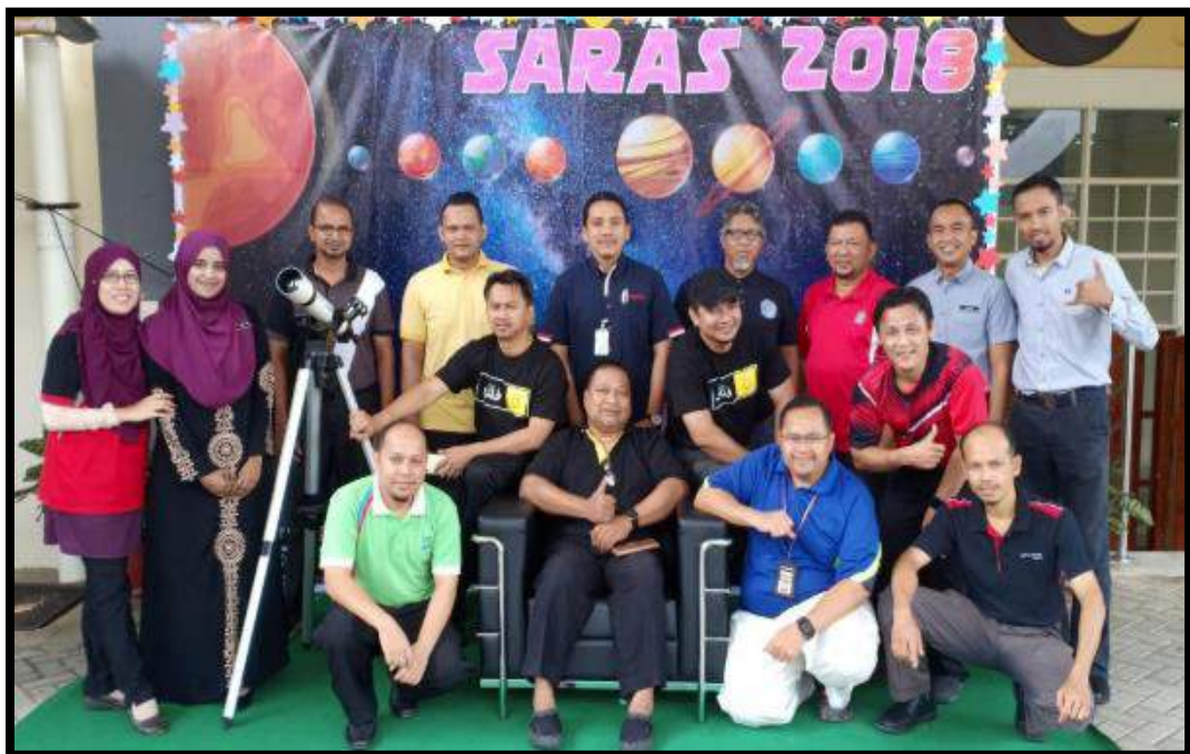
Sebahagian staf INSTUN dibahagian Ukur dan Pemetaan merangkap urusetia seminar SARAS