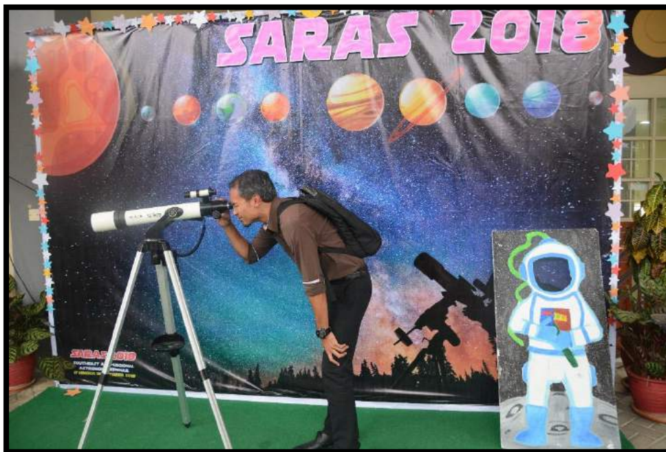
Aktiviti praktis cerapan teleskop di anjung auditorium