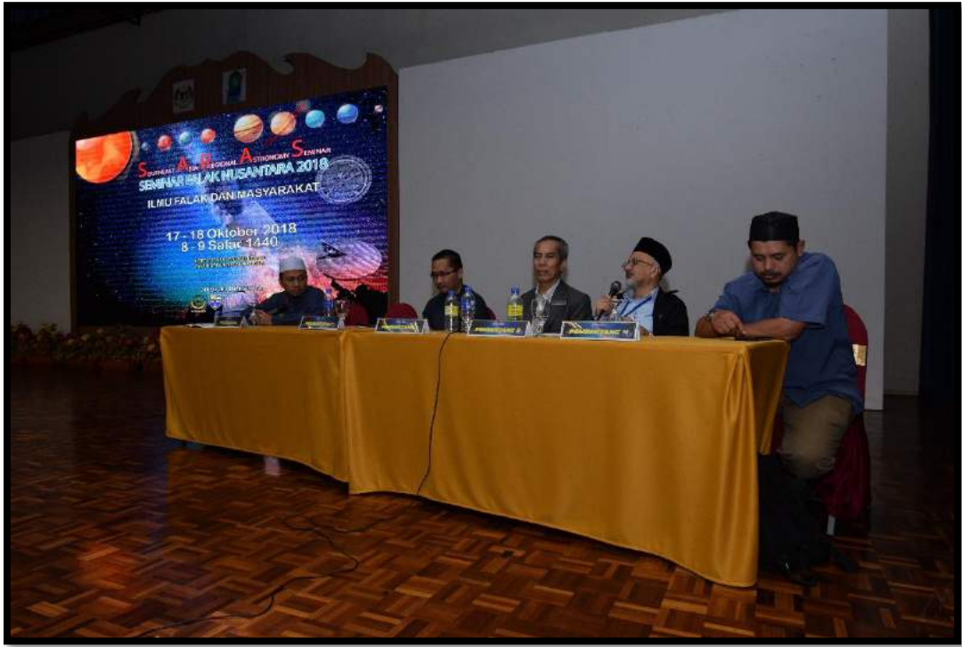
Sesi pembentangan kertas kerja