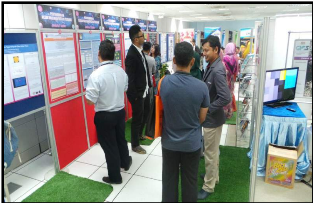
Pameran poster daripada para peserta seminar SARAS 2018