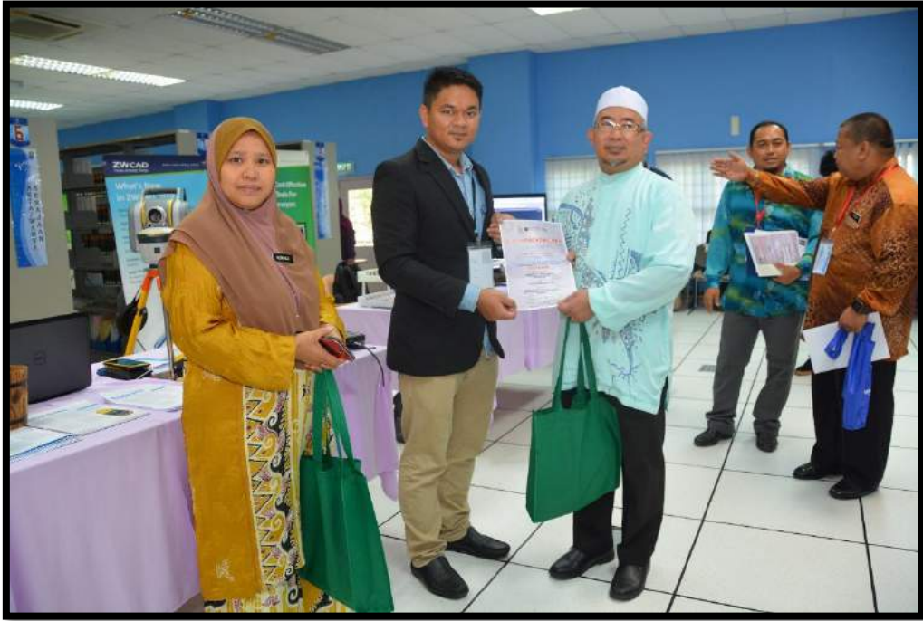
Penyampaian sijil penghargaan kepada syarikat luar yang menyertai seminar SARAS 2018