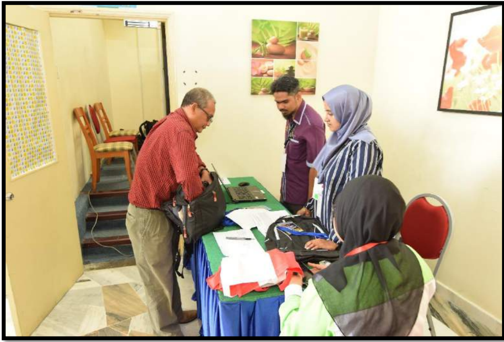
Proses urusan pendaftaran bagi moderator dan pembentang utama di pintu masuk auditorium