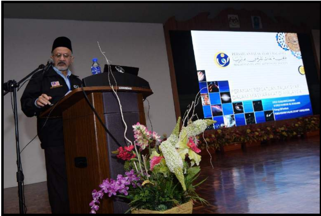
Pembentangan kertas kajian pada hari pertama