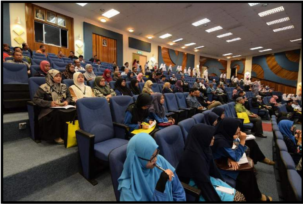
Suasana di dalam auditorium INSTUN semasa sesi pembentangan kertas kerja