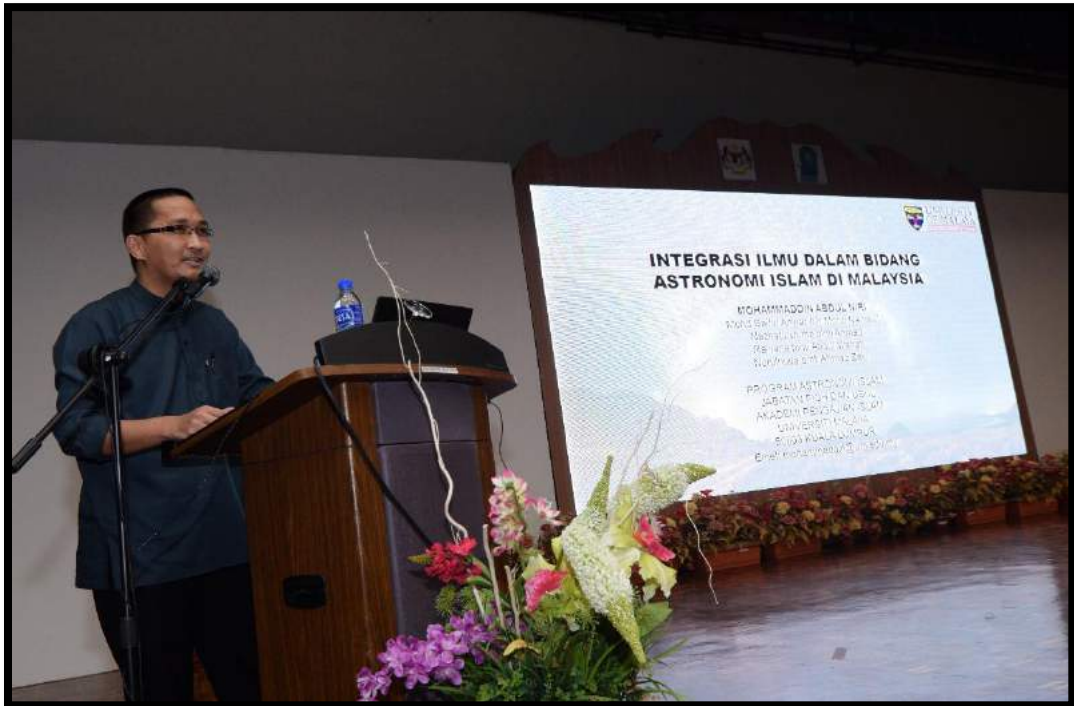
Pembentangan kertas kajian pada hari pertama