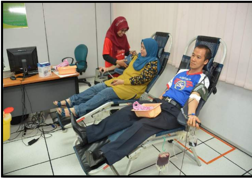
Aktiviti pemeriksaan kesihatan dan derma darah di perpustakaan INSTUN