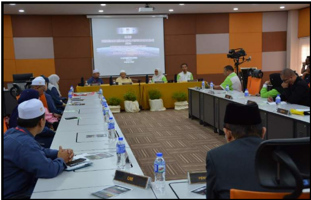
Majlis meterai MoU persefahaman diantara JMNPk dan INSTUN