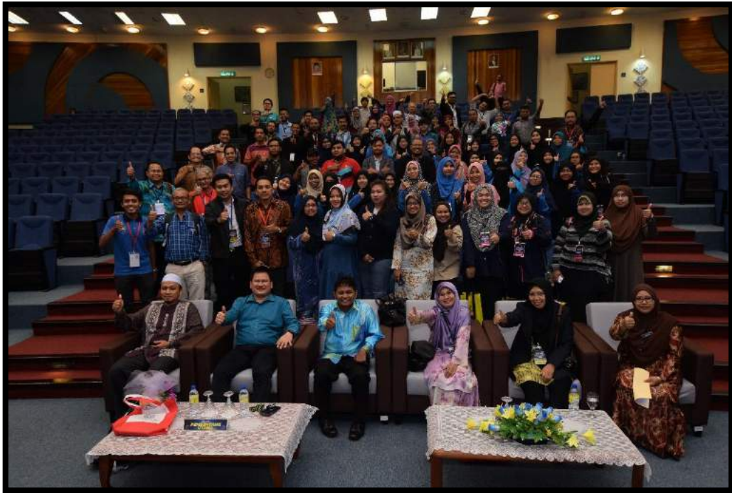
Gambar kenangan bersama barisan tetamu VIP dan para peserta di akhir majlis penutupan SARAS 2018