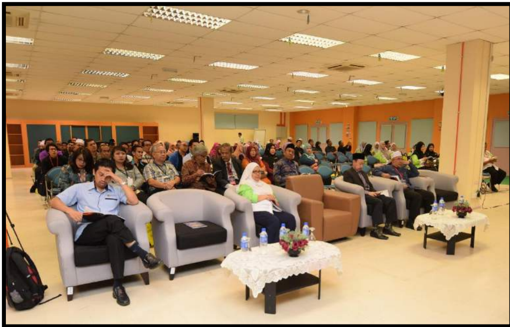
Barisan tetamu kehormat pada majlis perasmian yang bertempat di Dewan Kuliah Utama Blok Akademik C