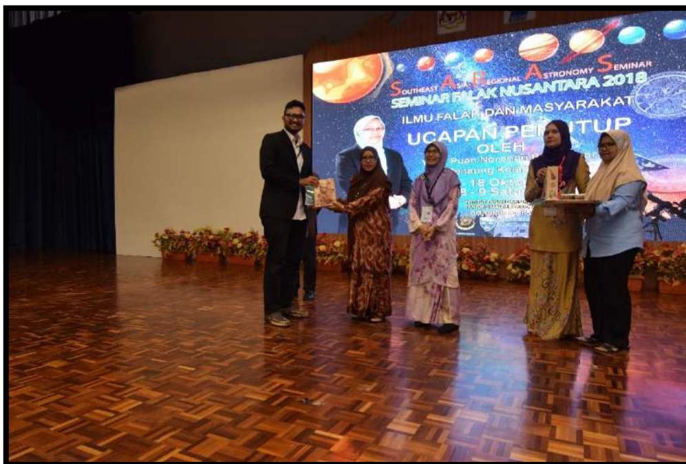
Sesi penyampaian hadiah kepada para pemenang bagi kategori pembentang kertas kerja terbaik