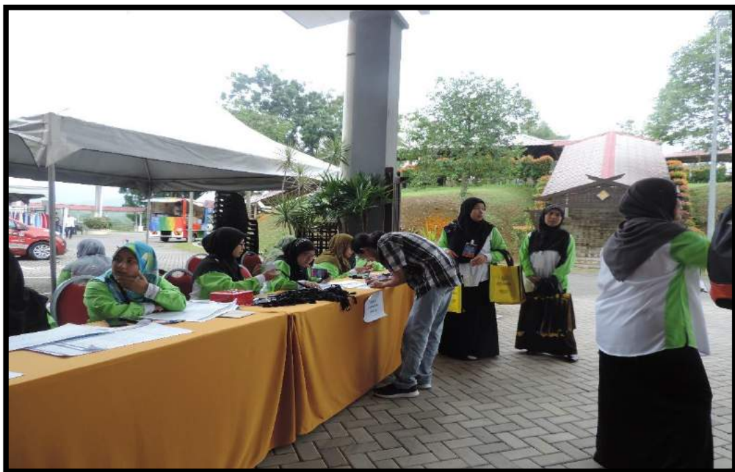
Para peserta mendaftarkan diri di kaunter pendaftaran