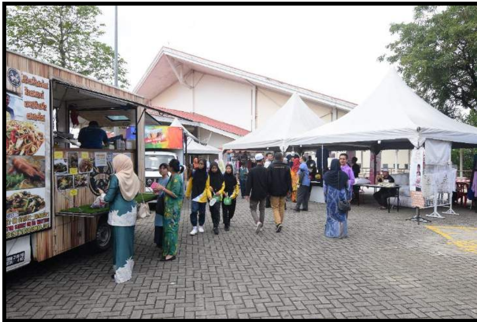
Suasana di tapak jualan di perkarangan auditorium INSTUN