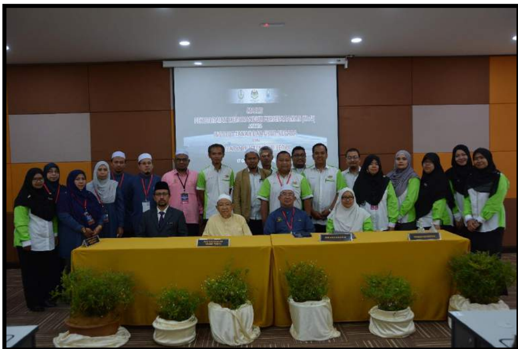
Gambar kenangan setelah selesai majlis MoU