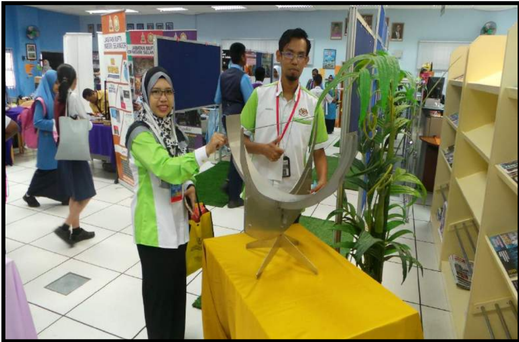
Aktiviti pameran falak / astronomi di perpustakaan INSTUN