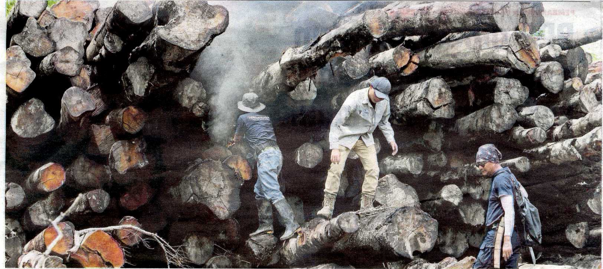
Ops Rajang II mengesan sembilan kem pembalakan haram berhampiran Taman Negara Bakau Rajang.