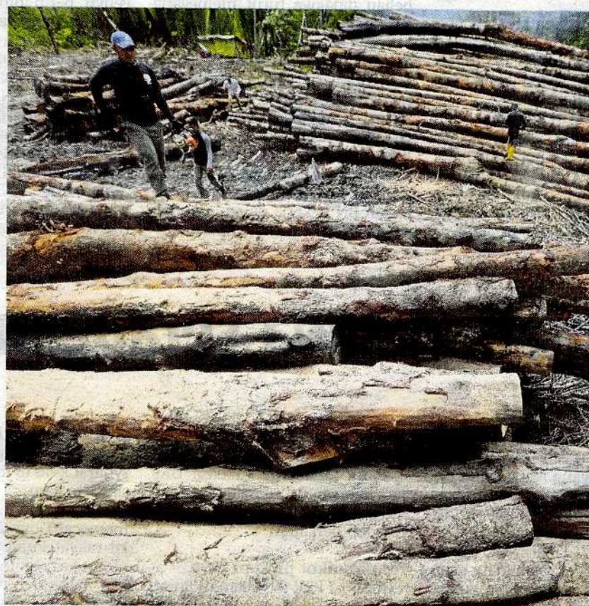
Kayu bakau dikumpul di tebing sungai bagi memudahkan dipindahkan ke dalam kapal tongkang milik sindiket.