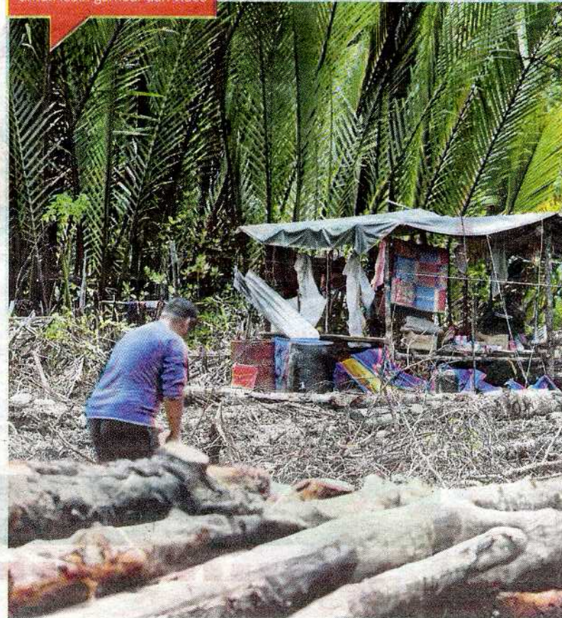
Ops Rajang II dedah taktik lanun rimba sasar hutan dilindungi.

BH PLUS di www.bharian.com.my untuk lebih gambar dan video