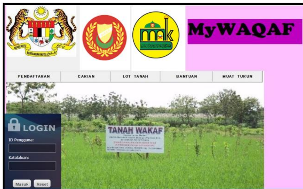
Rajah 3. Graphic User Interface (GUI) atau paparan muka hadapan sistem yang dihasilkan

Dalam kajian ini, pengkaji dapat memenuhi matlamat kajian untuk membangunkan sebuah sistem pangkalan data inventori wakaf menggunakan sistem GIS ( pilot test system ) dalam perisian Microsoft Visual Basic 5.0 yang diberi nama sistem MyWAQAF seperti pada Rajah 3.