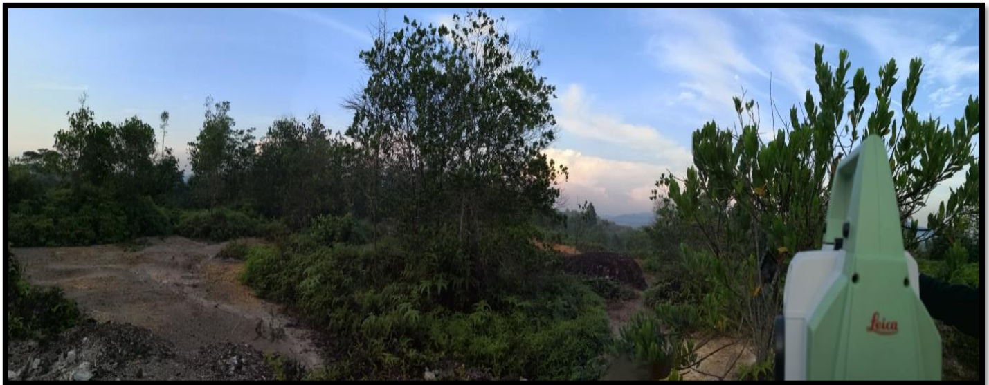
Gambar 3: Panaroma ufuk barat