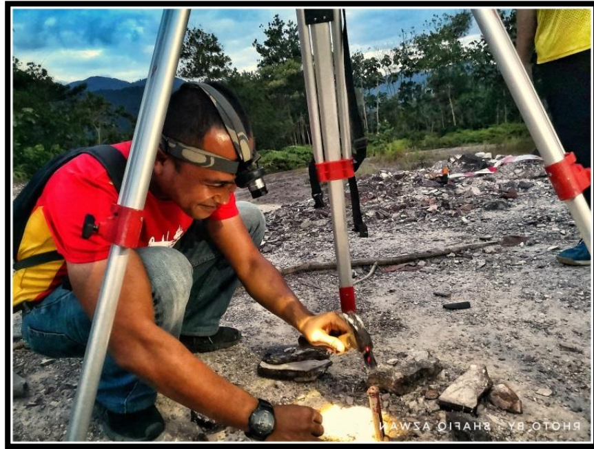
Gambar 1: Proses mendirikan stesen rujukan untuk penentuan azimuth