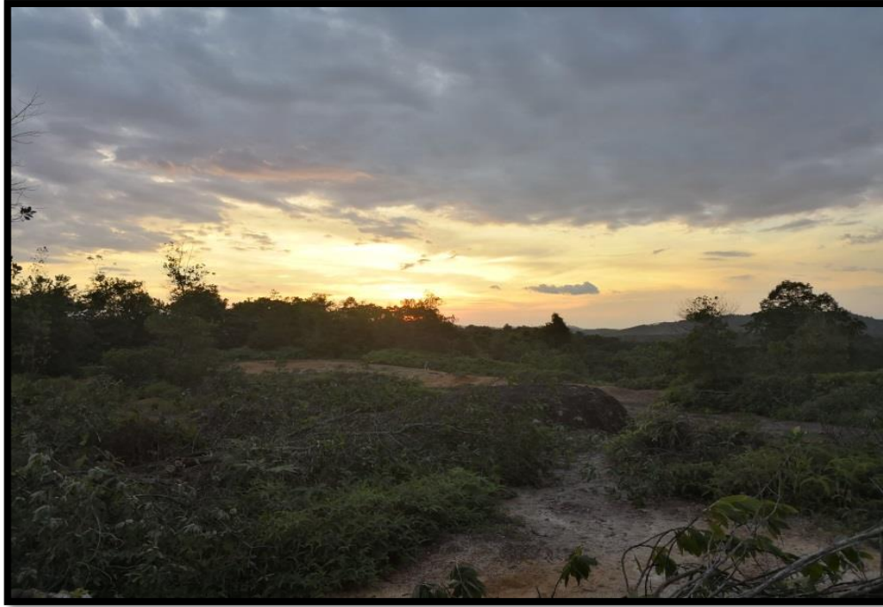
Gambar 4: Imej ufuk timur ketika matahari terbenam