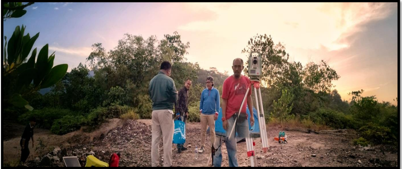
Gambar 2: Panaroma ufuk timur

Akan tetapi, sekiranya pokok-pokok di persekitaran tapak tersebut telah ditebang sekalipun, penulis yakin masih terdapat halangan ufuk yang berpunca dari Banjaran Titiwangsa yang mempunyai kadar ketinggian altitud 9^{\circ} 41' 52'' .